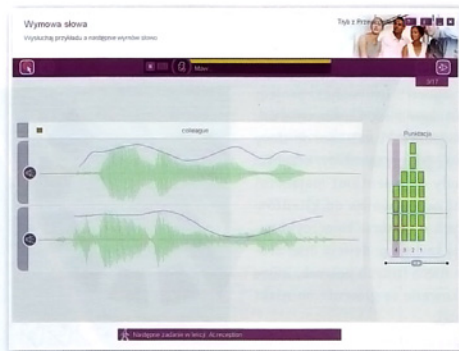
Moduł rozpoznawania mowy – analiza wypowiedzi w stosunku do oryginału

sumiennie przykładają się do nauki. Dlatego też w obliczu rozwijającego się trendu przechowywania zasobów w chmurze warto rozważyć ten sposób